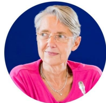
Élisabeth Borne, ministre de la Transition écologique et solidaire

Les perspectives sont vastes, créons les conditions pour qu'elles profitent à tous.