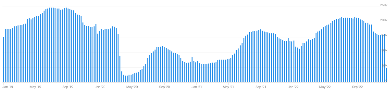
Évolution du trafic européen de 2019 à 2021

Par ailleurs, selon les prévisions d'Eurocontrol (cf. présentation annexée) la reprise au niveau de 2019 est estimée vers l'année 2025.