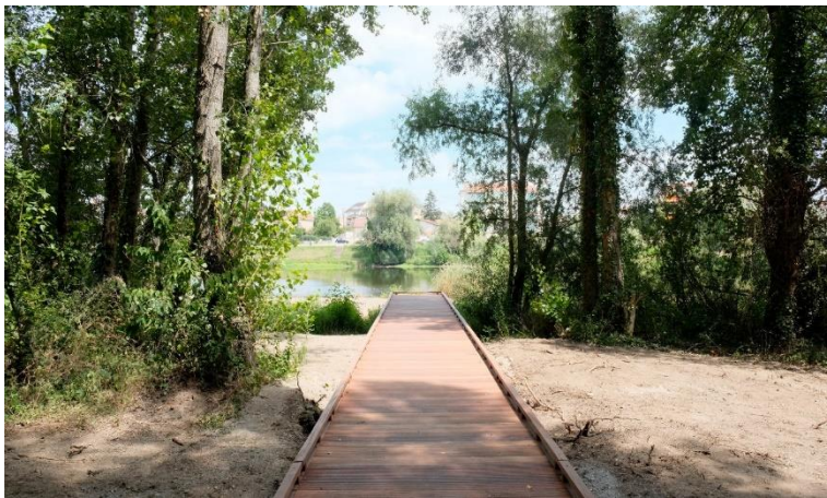
Figure 7 : Platelage en bois jusqu'à la rivière

La circulation PMR est prolongée jusqu'à la zone de baignade avec intégration de dispositifs pour faciliter l'accès à l'eau des PMR : pontons et platelages bois (figure 7).