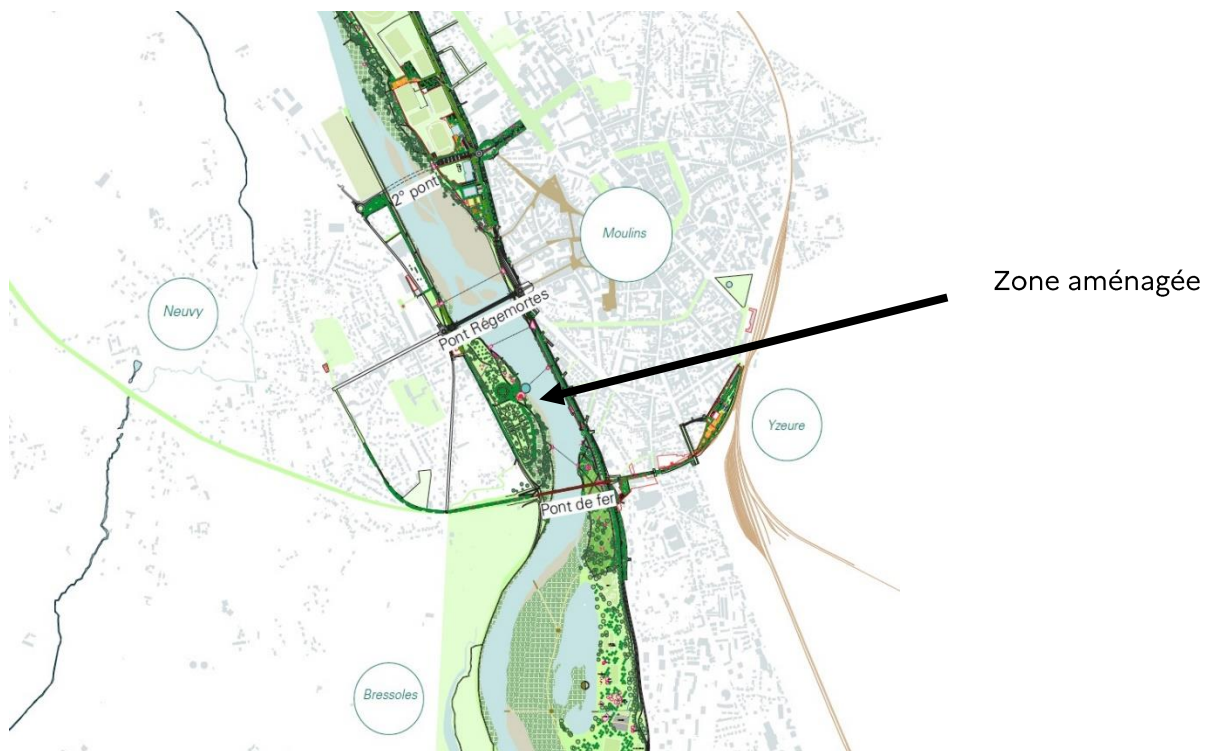
Figure 4 : Projet d'aménagement des berges au niveau de la plaine du camping entre le Pont Régemortes et le Pont de Fer (rive gauche de L'Allier), Moulins Communauté (2022)

Moulins Communauté mène une politique de reconquête de L'Allier basée sur la mise en valeur de son patrimoine paysager et environnemental. En 2018, un schéma directeur d'aménagement des abords de la rivière d'Allier a été acté. Le projet d'aménagement des berges prévoit de faciliter les déplacements autour de la rivière via un ensemble de boucles de promenade pour permettre à toutes et tous de renouer avec L'Allier. Il s'agit de rendre les berges accessibles aux mobilités douces.