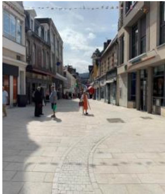
Figure 1 : Nouvelle rue piétonne de Fécamp (Ville de Fécamp, 2023) Avant travaux (gauche) et après travaux (droite)