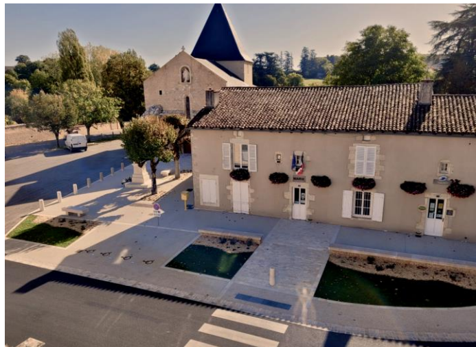
Figure 10 : Aménagement de la place du Général de Gaulle, de la voirie et des cheminements devant la mairie de la ville de Payroux

La commune de Payroux a sollicité l'Agence des Territoires de la Vienne (AT86) pour l'assister dans son projet d'aménagement de son cœur de bourg.