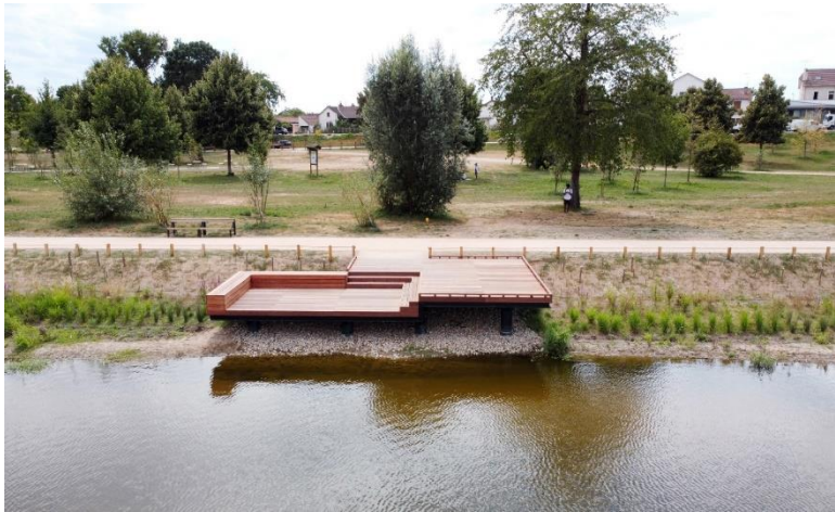
Figure 5 : Chemin en stabilisé renforcé et ponton accessible pour les personnes à mobilité réduite (Moulins Communauté, 2022)

Tous les cheminements de projet sont adaptés à tous. Depuis le pont de Régemortes jusqu'au Pont de Fer, un cheminement adapté à tous se déploie, en béton bouchardé clair dans les zones urbaines (figure 5) et en stabilisé renforcé dans les zones naturelles (figure 6).