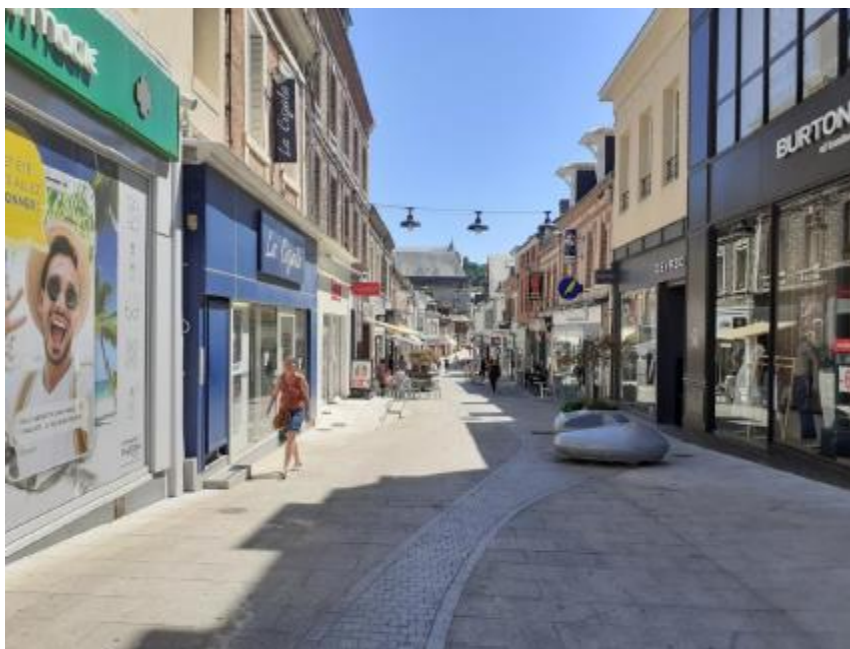
Figure 3 : Nouvelle rue piétonne de la ville de Fécamp (Ville de Fécamp, 2023) Avant travaux (en haut) et après travaux (en bas)