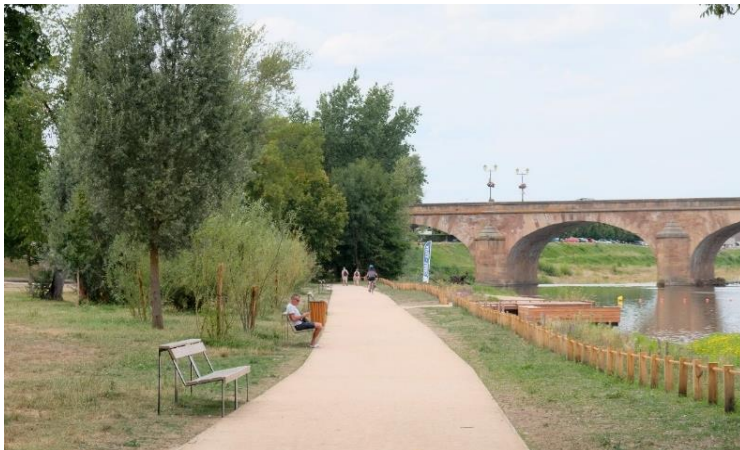
Figure 6 : Aire de promenade en bords de rivière avec un chemin en stabilisé renforcé (Moulins Communauté, 2022)

Plusieurs rampes permettent de rejoindre les berges depuis les digues avec un traitement spécifique des circulations douces : intégrer à la voirie dans les zones circulées ou en site propre.