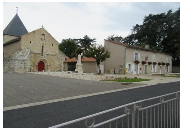
Figure 9 : Place du Général de Gaulle à Payroux À gauche : avant travaux ; à droite : après travaux