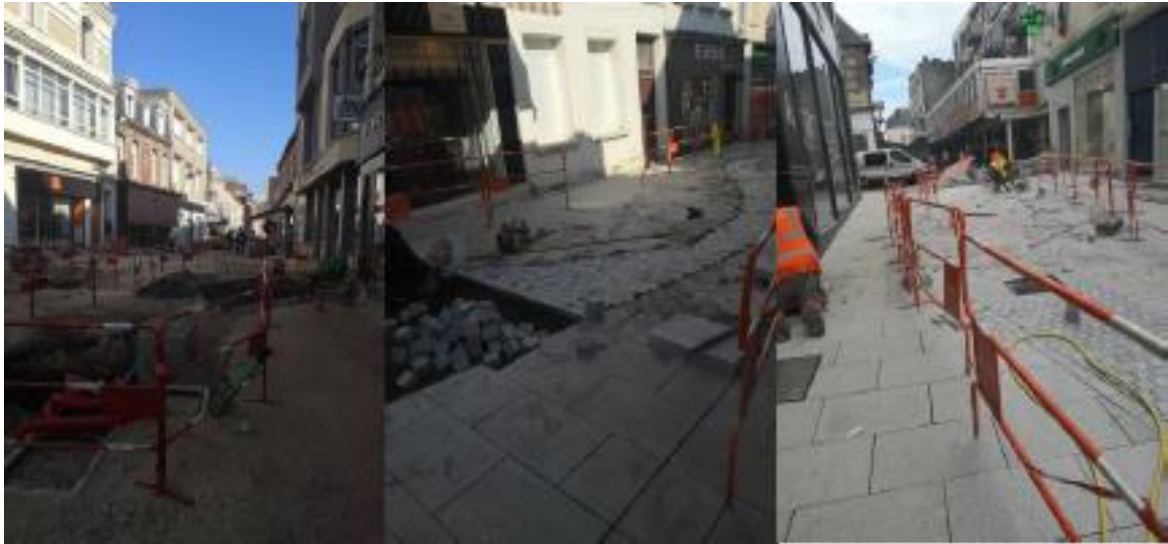
Figure 2 : Travaux de la voirie dans le centre-ville de Fécamp