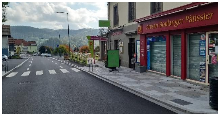
Figure 11 : Aménagement du centre bourg de Le Tholy En haut à gauche : parvis de la Maison des associations En haut à droite : aménagement de Rue du Paradis (église) En bas : trottoir et traversée piétonne sur la D11